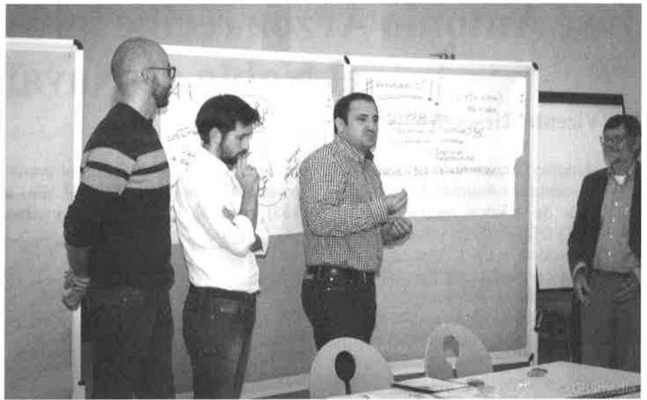
Grupo presentando su propuesta de apoyo a los refugiados

tema en el que pueden implicarse las organizaciones de emigrantes fue un objetivo del seminario el plantear propuestas de acción que fueran prácticas y aplicables a corto y medio plazo. De los grupos salieron diferentes iniciativas, entre otras: creación y desarrollo de programas de integración cultural, involucrar a empresas privadas, fomento de la concienciación ciudadana a través de voluntarios e implicación de personalidades, uso de hashtags#, creación de grupos interculturales de profesionales que ofrezcan apoyo psicológico, organizar encuentros ciudadanos, voluntariado bilateral, talleres de formación: