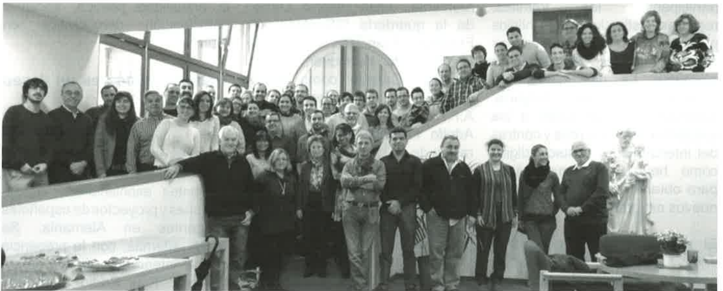
Participantes del seminario en Vallendar

Aumenta el interés por la participación y la organización entre los nuevos emigrantes hispanohablantes en Alemania. Exitoso seminario en Vallendar para nuevos emigrantes y padres jóvenes