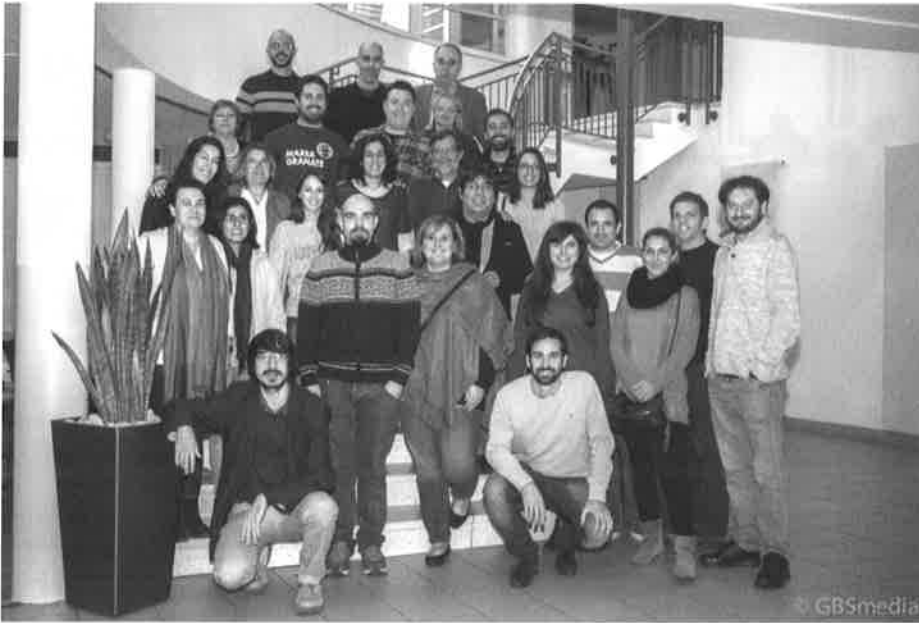
Grupo de participantes al seminario

Seminario “Avanzamos” para nuevos emigrantes y voluntarios de las asociaciones