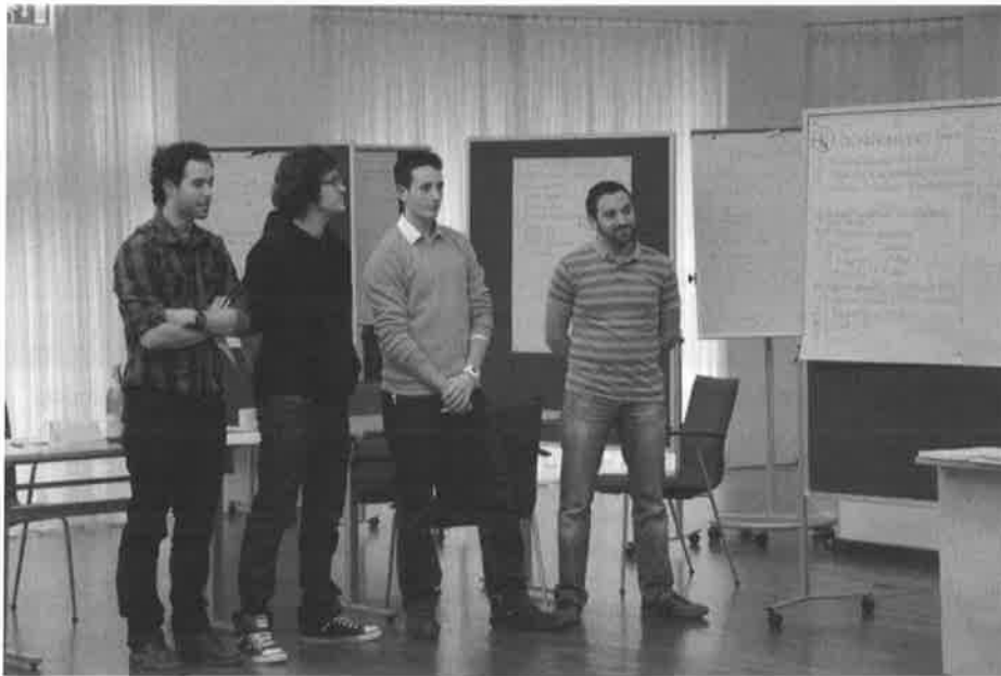
Grupo de jóvenes presenta su proyecto de empresa